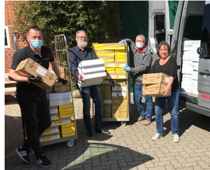
In Corona-Zeiten rettete Plan B viele hundert Lebensmittel des Caterers Speisenwerft bei Tim Mälzer

Plan B wird unterstützt und gefördert von: