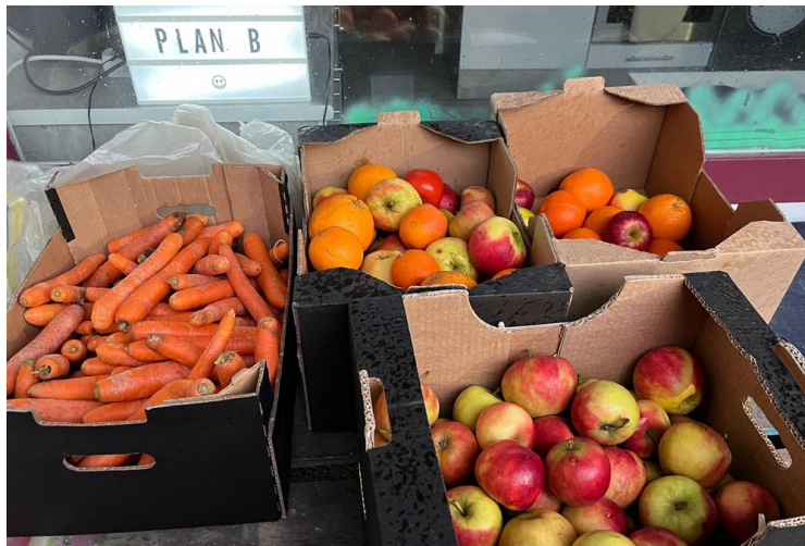
Die Oldesloer Foodsharing-Gruppe beliefert regelmäßig den Hölk